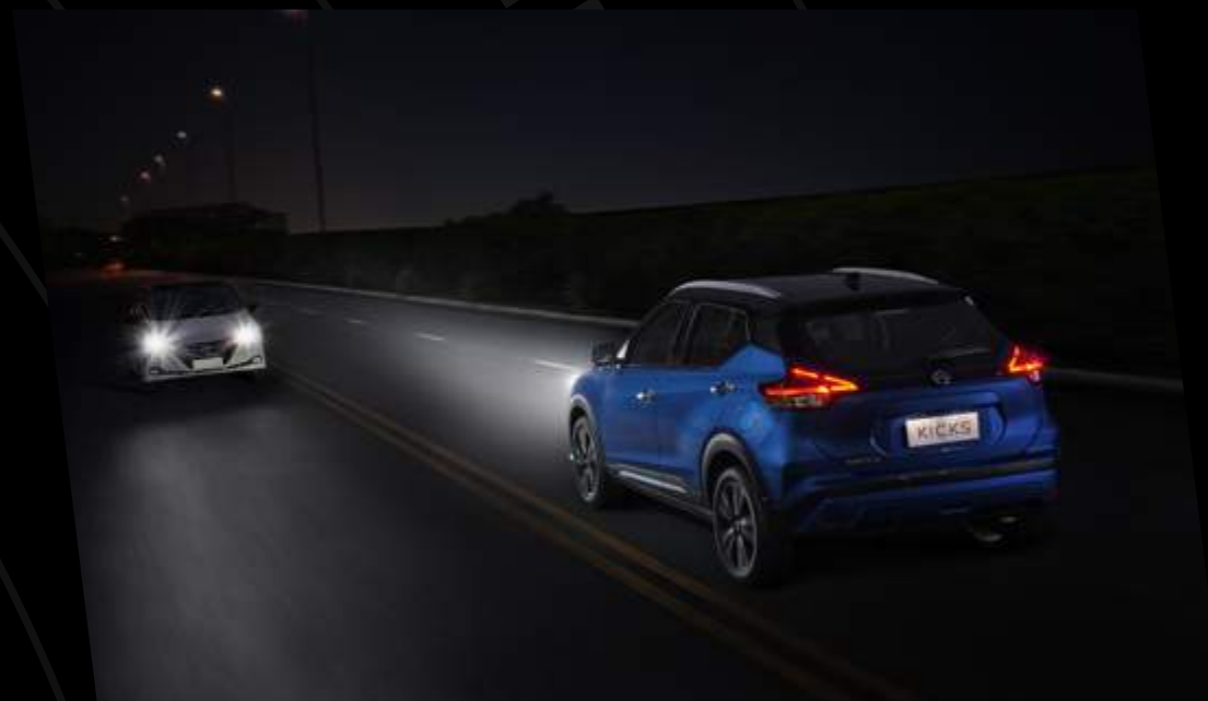
Asistente de Cambio de Intensidad de Luces (HBA)