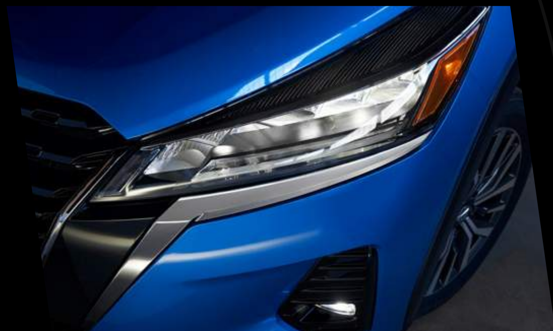
Faros delanteros LED con signature lamps (DRL)