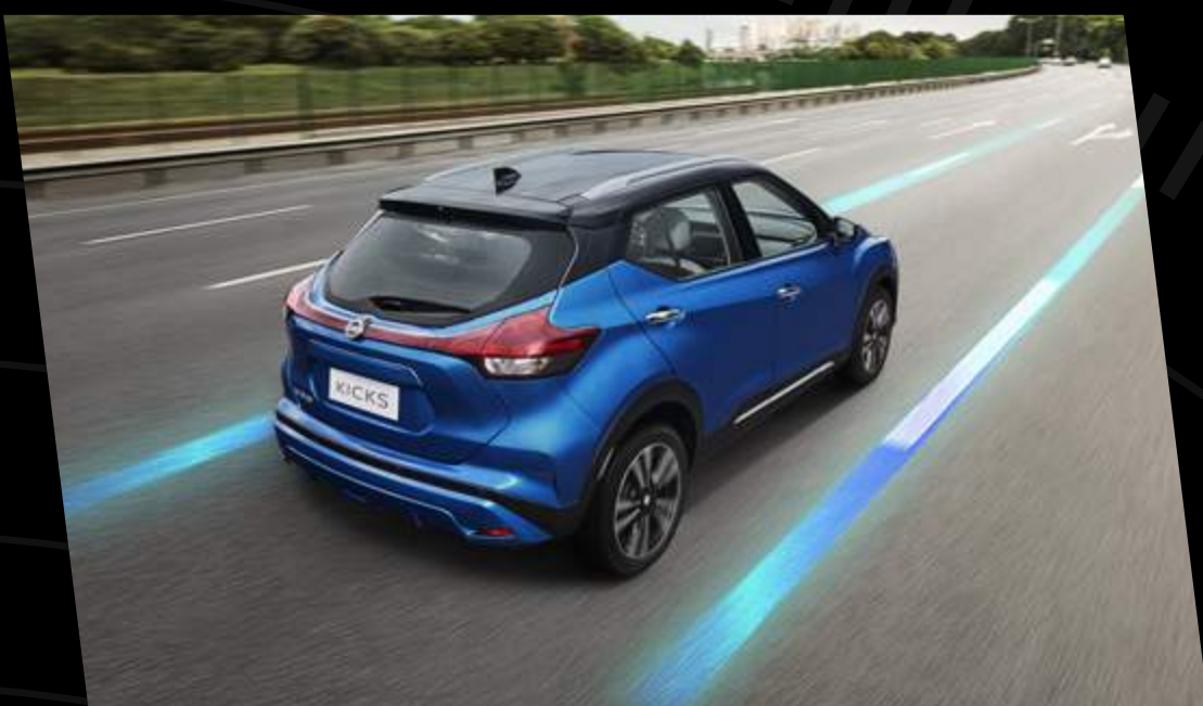
Alerta de Cambio de Carril (LDW)