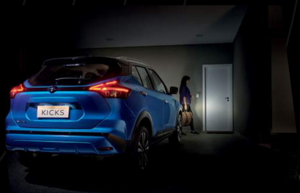
Luces automáticas con temporizador (follow me home) y función de bienvenida

Las fotografías e imágenes son referenciales.